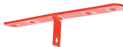
Pulversprinkler 12 kg