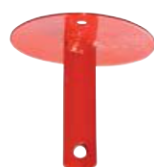
Pulversprinkler 2 kg och 6 kg